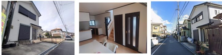
橿原市石原田町 平成21年築一戸建住宅

全面6M道路 =住宅ローン支払例= 2050万 1.625% 【月々¥64100円】